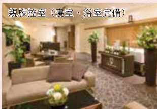
親族控室 (寝室・浴室完備)