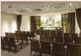
ホール (お席の間隔をあげています)