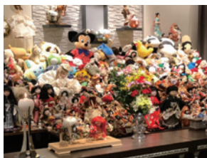
※過去の供養の写真です。