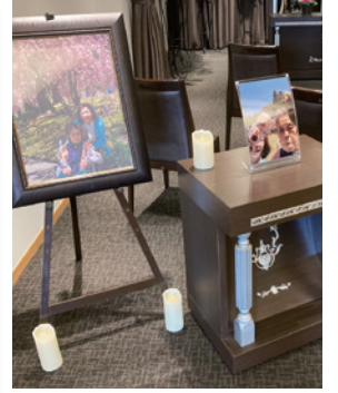
思い出コーナーに飾った写真から母が好きだった桜や団子をご用意してくださり、とても感動しました。