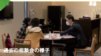
過去の相談会の様子