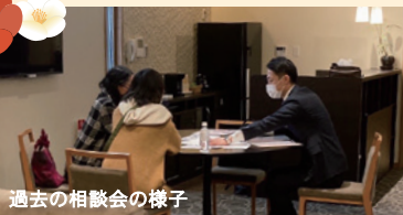
過去の相談会の様子